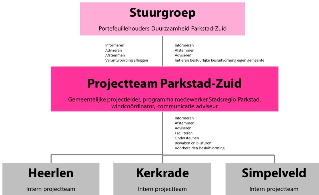
Figuur 1: Governance windenergie Parkstad-Zuid

De bestuurlijke stuurgroep zorgt voor de nodige richting en keuzes in het traject en de leden initiëren de benodigde bestuurlijke besluitvorming in de eigen gemeente. Het gezamenlijk projectteam legt verantwoording af aan deze stuurgroep. Hieronder staat in figuur 1 de governance voor windenergie Parkstad-Zuid schematisch weergegeven.